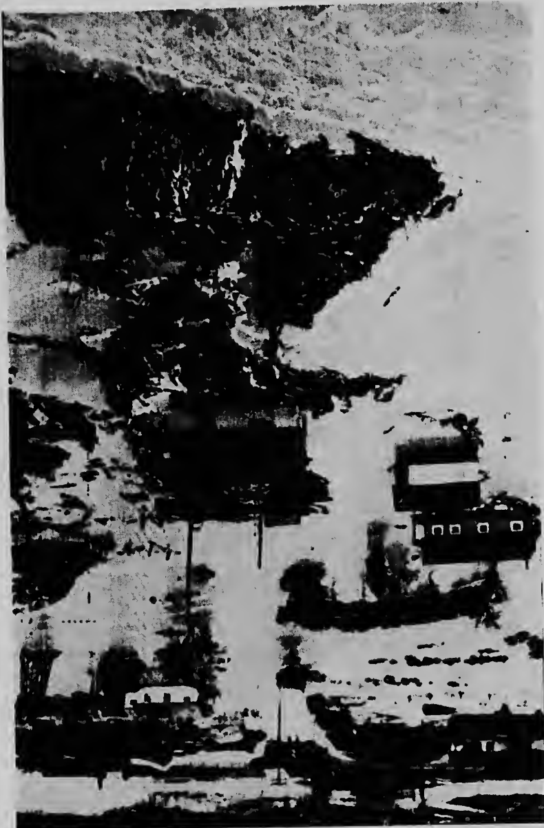
EUREKA, CALIFORNIA-- Riba e foto aki nos por mira con e awa di e rieuw Van Duzen cu tabata ijs a dirti atrobe y ta corre den e ciudad di Starvation, mas o menos 25 milla for di e ciudad aki. Algun familia cu mester a ser evacua te ainda ta den nan cas.

Lawford, nace na Gran Bretaña, tin 41 año di edad. El a contrae matrimonio cu Pat II año pasa, na ciudad di New York. Peter a cuminsa su labor na Hollywood como actor hubenil, y e tabata estrella principal di peliculan manera "Advise and Consent", "Exodus" y "Oceans 11". Awor e ta productor di un programa di television.